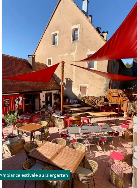
Ambiance estivale au Biergarten