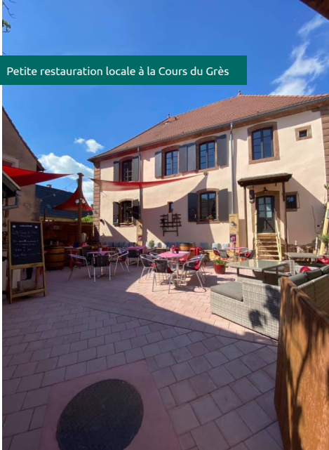
Petite restauration locale à la Cours du Grès