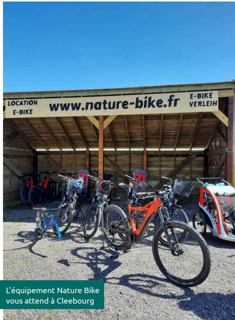
L'équipement Nature Bike vous attend à Cleebourg