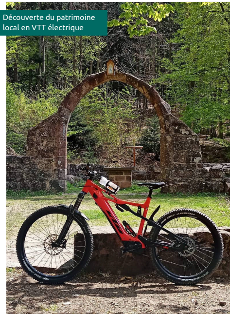
Découverte du patrimoine local en VTT électrique