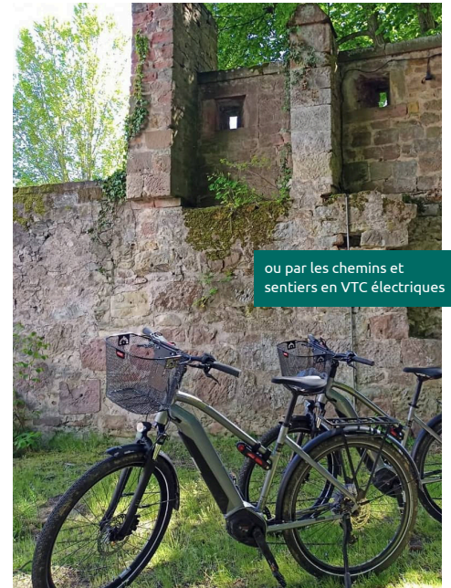
ou par les chemins et sentiers en VTC électriques