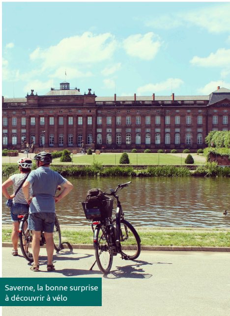
Saverne, la bonne surprise à découvrir à vélo