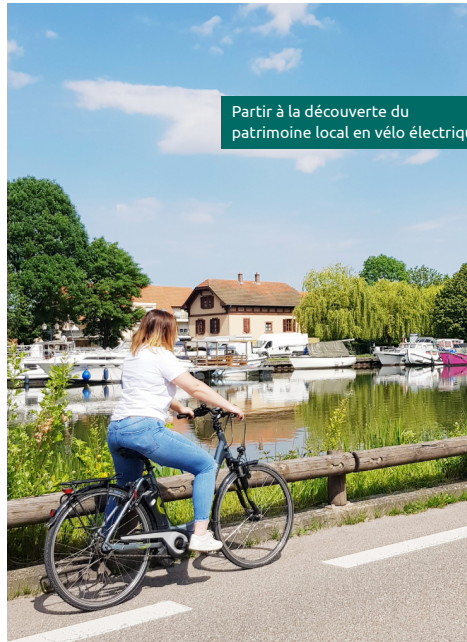
Partir à la découverte du patrimoine local en vélo électrique