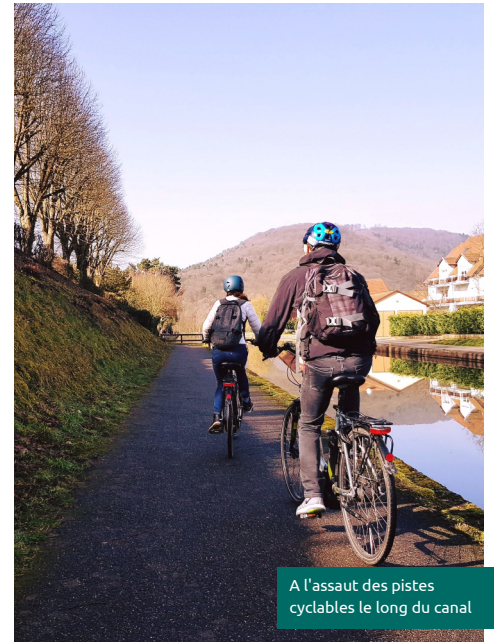
A l'assaut des pistes cyclables le long du canal