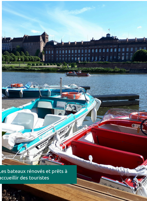
Les bateaux rénovés et prêts à accueillir des touristes